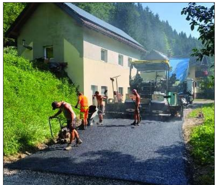
Eine "ewige" Baustelle ist leider die Straße in die innere Wimitz. Kleinere Abschnitte konnten aber heuer saniert werden.