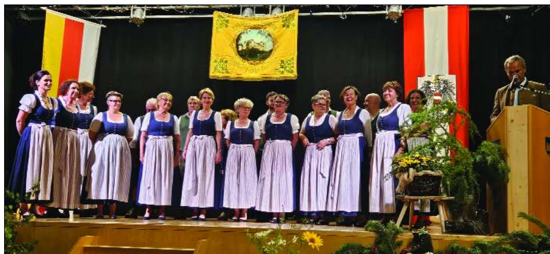
Der Singkreis Frauenstein gestaltete gemeinsam mit dem MGV Wieting, dem MGV Barendorf und dem Terzett Pappaltur Manufaktur das "Singen in die Sommernacht" im Kultursaal Kraig.

Ein besonderes Highlight in diesem Jahr war unser traditionelles "Singen in die Sommernacht". Trotz eines unerwartet starken Unwetters, das über die Region zog, war der Kultursaal in Kraig bis auf den letzten Platz gefüllt. Die stimmungsvolle At-