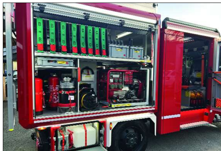
Mit der modernsten Ausstattung ist die FF Obermühlbach-Schaumboden in der Lage, noch besser zu helfen.