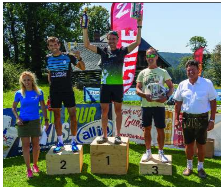
Bei großer Hitze mussten die Teilnehmer des Berglaufs die anspruchsvolle Strecke auf den Kraigerberg bewältigen.