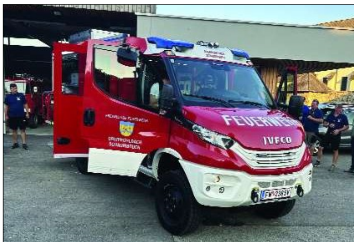
Das neue Löschfahrzeug der Marke Iveco wurde am 29. Juli von Niederösterreich nach Obermühlbach überstellt.