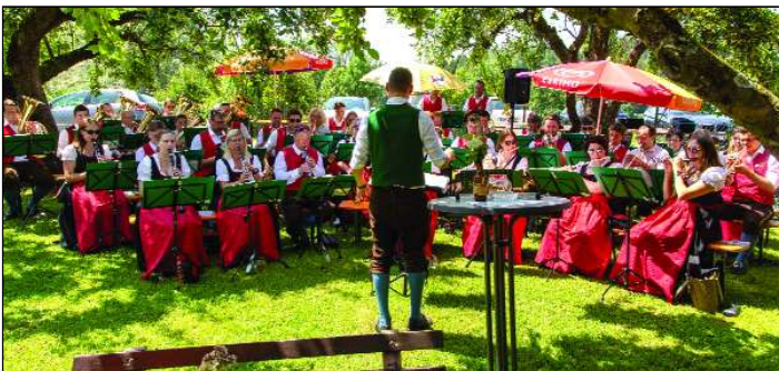
Mit einem zünftigen Frühschoppen eröffnete die Glantaler Blasmusik den traditionellen Treffelsdorfer Kirchtage.