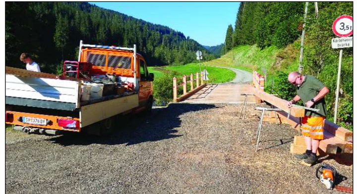
Die "Karlbauer"-Brücke in der Wimitz wurde erneuert.

Sanierung von Schotterstraßen nach Unwetter im heurigen Jahr wie z. B. die Zaubersdorfer Straße, Kalkgruber Straße, Schaumboden Rich-