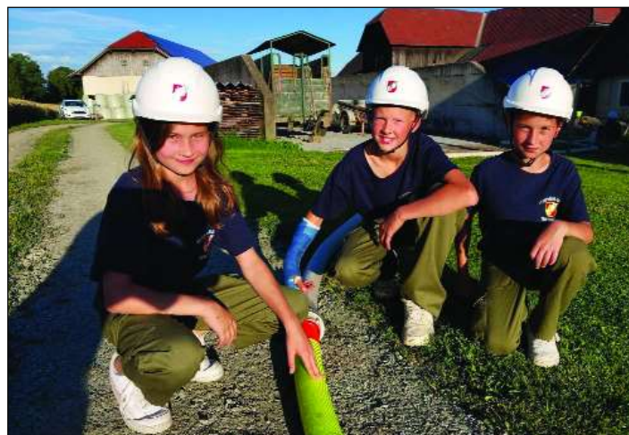
Immer mit Begeisterung bei der Sache ist die Feuerwehrjugend der FF Treffelsdorf und Obermühlbach-Schaumboden.

Besuchen Sie uns auch auf www.ff-treffelsdorf.at Julia Remschnig