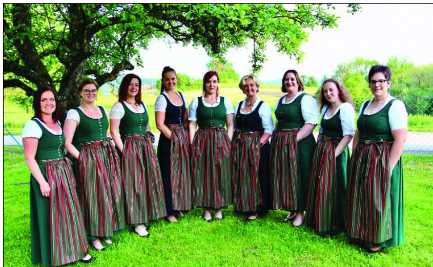
Die Damen der Singgemeinschaft Wimitzerberge luden zum Sommerfest.

volles und abwechslungsreiches Konzert geboten. Bei traumhaftem Wetter wurde bis in die frühen Morgenstunden gesungen und gefeiert!