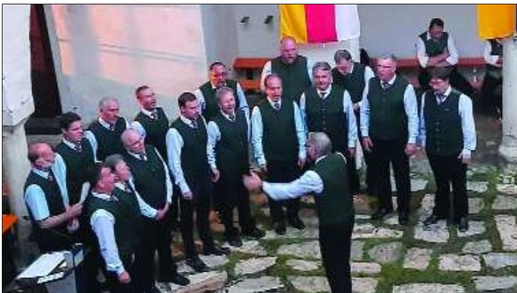
Die Sängerrunde Obermühlbach lud zum alljährlichen Schloßhofsingen ins Schloß Frauenstein.