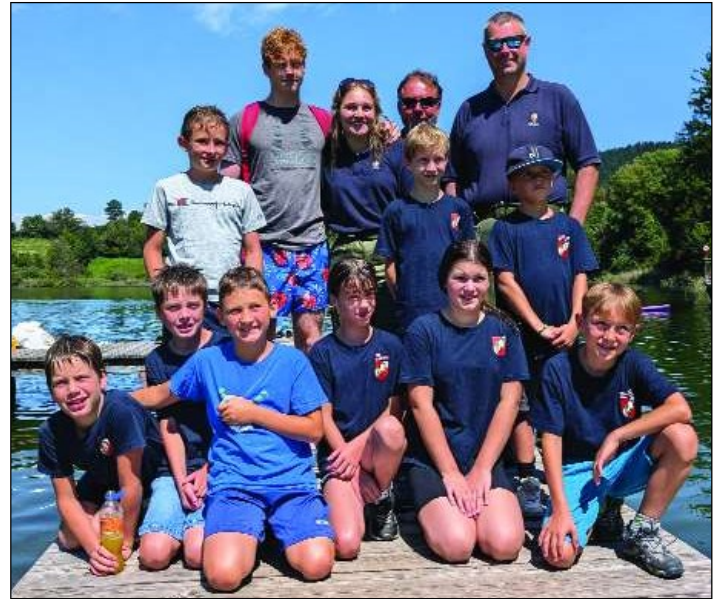
Die Feuerwehrjugend von Kraig.

Besuchen Sie die Freiwillige Feuerwehr Kraig unter www.facebook.com/ffkraig