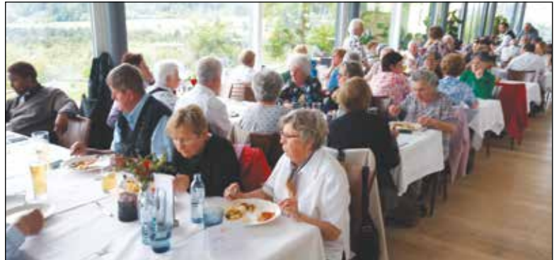
Unsere Senioren beim heurigen Muttertagsausflug und gemeinsamen Essen im Stift St. Georgen am Längsee.

Die Junifahrt ging heuer in das Lavanttal nach Wolkersdorf zur Knusperstube. Dort konnten wir an einer sehr interessanten Führung teilnehmen, die uns die Aktivitäten dieses Großbetriebes, der die Firma Hofer in ganz Österreich mit den verschiedensten Backsorten beliefert, teilnehmen. Nach einer Kaffeepause fuhren wir weiter