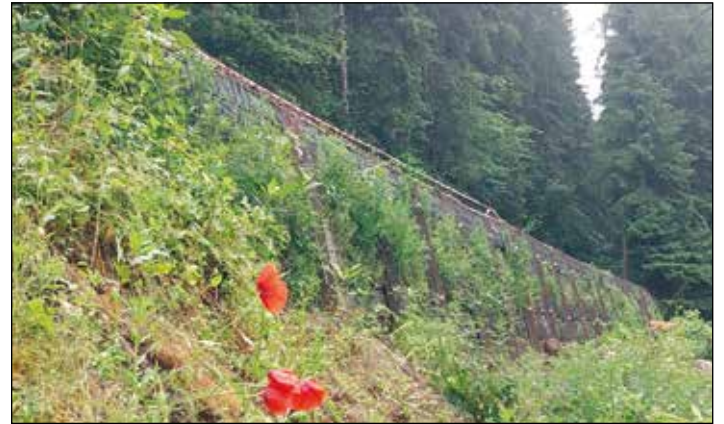
Leitschienen werden unter anderem heuer auch an der Meiseldinger Straße angebracht.

Wir wünschen weiterhin eine gute Fahrt auf den Straßen der Gemeinde Frauenstein.