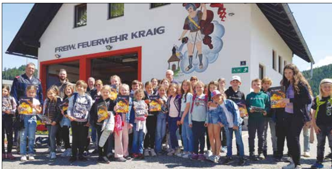
Die Volksschulklassen der VS Kraig besuchten Ende Mai die Feuerwehr Kraig.

Die Wettkampfgruppe der FF Kraig konnte am 25. Mai ihr Können beim Bezirksleistungswettbewerb in Brückl unter Beweis stellen. Die vierte Wettkampfgruppe konnte hierbei im Bewerb Silber A den vierten Platz belegen. Beim Bewerb in Bronze A erreichten wir den hervorragenden zweiten Platz!