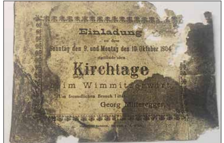
Die Einladung zum "Wimitzter Kirchtag" aus dem Jahr 1904 belegt die 120jährige Geschichte des Kirchtags.