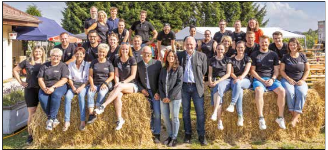
Das Team des Turnvereins Kraig bedankt sich bei allen Sponsoren, ehrenamtlichen Helfern, ehemaligen Funktionären und Freunden für die Unterstützung in den letzten 60 Jahren.

Mit 450 Gästen bestens besucht war die Feier anlässlich des 60-Jahr-Jubiläums des Kraiger Turnvereins am 22. Juni. Der Wettergott erwies sich als Turn- und Sportfan und aus diesem Grund konnten die Festlichkeiten in gemütlicher Lagerfeueratmosphäre am Gelände in Überfeld stattfinden. Neben Auftritten des Singkreises Frauenstein, Darbietungen der Glantaler Blasmusik und dem Auftanz der Landjugend Frauenstein, bot das Programm mit der Band "Unbranded" feinste Countrymusik, die zum gemeinsamen Line Dancing vor der Bühne einlud. Um 21 Uhr folgte das fulminante Konzert der Kärntner Band "Humus", das viele Fans aus Österreich und aus Deutschland anlockte.