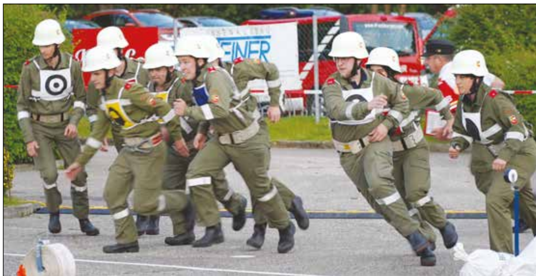
Die Wettkampfgruppe der FF Treffelsdorf wurde heuer Bezirksmeister und konnte auch bei der Feuerwehr-Landesmeisterschaft in St. Veit ihr Können zeigen. Herzliche Gratulation!

Die Feuerwehren aus den Bezirken St. Veit/Glan und Feldkirchen bilden gemeinsam den vierten Katastrophenhilfszug des Landes Kärnten. In den letzten beiden Jahren rückten wir zum Hilfeinsatz nach Treffen und in den Bezirk Völkermarkt