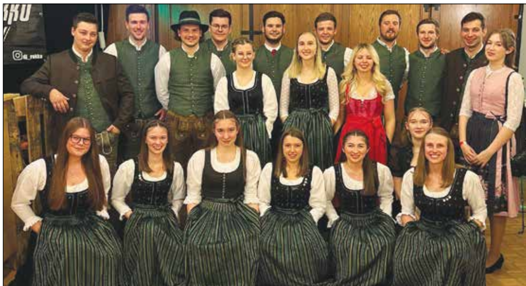
Die Landjugend Frauenstein konnte sich heuer den Landjugend-Champion holen und wurde auch noch zur zweit-aktivsten Ortsgruppe in Kärnten gekürt.

Unser heuriges Tatort Jugend Projekt "Ein Zeichen für die Zukunft setzen", bei wel-