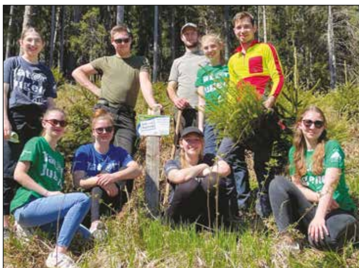
Bei unserem heurigen Projekt „Ein Zeichen für die Zukunft setzen“ halfen wir fleißig einer Familie in unserer Gemeinde, viele neue Bäume zu pflanzen.