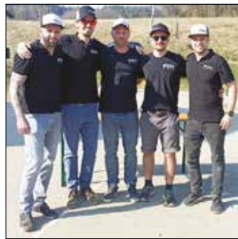
Das Team von PZN-Events.

Am 6. April, bei herrlichem Wetter, veranstalteten wir unser viertes Birkenstockturnier am Sportplatz Obermühlbach. Mit 20 Teams begann um 9 Uhr der Kampf um den ersten Platz - auf diesem Wege nochmals herzlichen Glückwunsch an den Sieger FF Treffelsdorf. Ein großes Dankeschön an alle Teilnehmer und Unterstützer, die mit uns bis in die späten Abendstunden gefeiert haben.