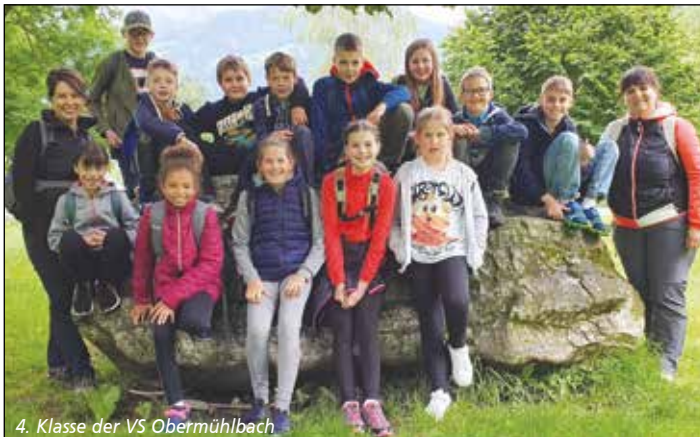
4. Klasse der VS Obermühlbach