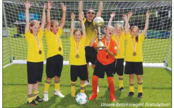
Unsere Bezirkssieger! Gratulation!