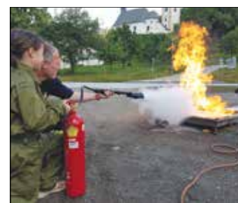
Die Schüler waren begeistert von den lehrreichen Ausführungen der Feuerwehr Kraig.

Am Freitag, dem 24. Mai 2024, durfte die Freiwillige Feuerwehr Kraig die dritten und vierten Klassen der Volksschule Kraig im Rüsthause begrüßen. Wir hatten dort einen interessanten Stationsbetrieb für die Kinder vorberei-