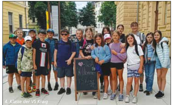
4. Klasse der VS Kraig