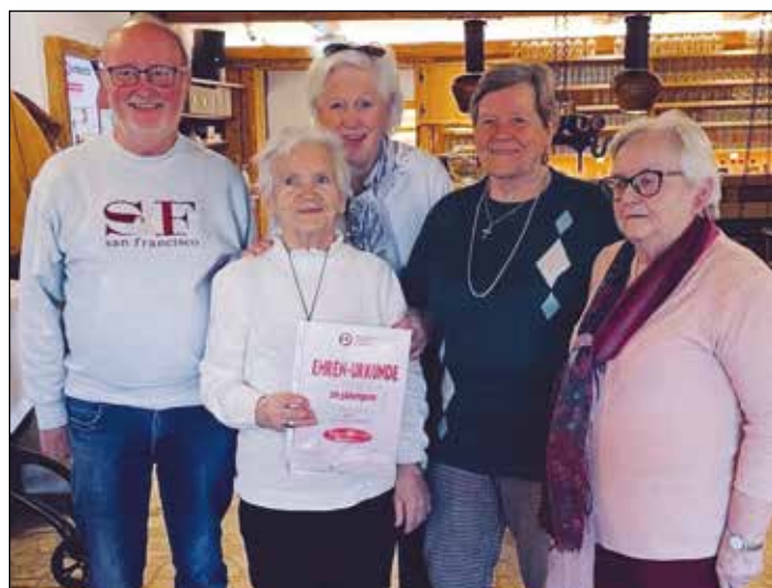
Viele verdiente Mitglieder wurden für ihre langjährige Treue zum Pensionistenverband geehrt.

Obmann des Pensionisten- verbandes Österreich - Ortsgruppe Frauenstein. Kontakt: 0676 3416450