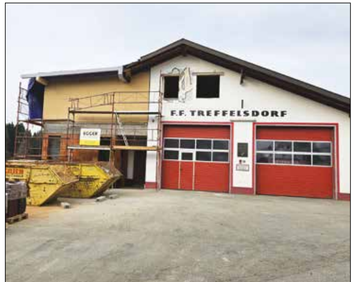
Die Umbau- und Sanierungsarbeiten am Rüsthaus der Feuerwehr Treffelsdorf sollten bis zum Sommer abgeschlossen sein.