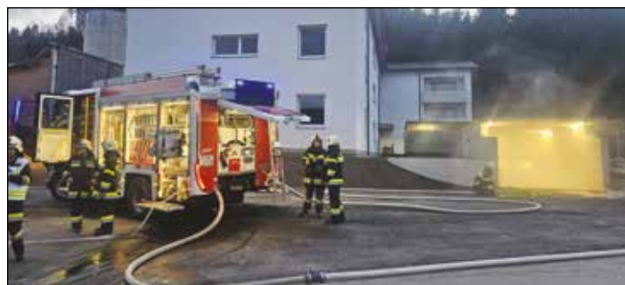
Die diesjährige Gemeindeübung der Frauensteiner Feuerwehren fand beim neuen Wohnbauprojekt in Kraig statt.