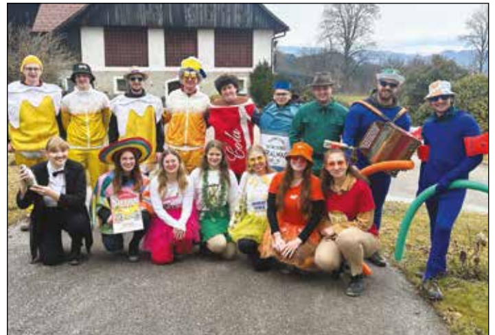
Die Landjugend Frauenstein beim diesjährigen Faschingsumzug in unserer Gemeinde. Danke an alle Familien, die uns so herzlich empfangen und verköstigt haben.