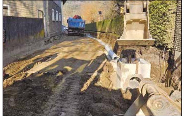
Die Sanierung der Dorfstraße mit neuer Wasserleitung, Straßenwasserkanal, Glasfaserverrohrung, Straßenbeleuchtung und Asphaltierung wird bis zum Sommer abgeschlossen.

Ein großes Danke an die Kameradinnen und Kameraden der Feuerwehr Treffelsdorf mit Kommandant Simon Remschnig, die mit ihrer Mitarbeit am Umbau wesentlich zur Kostensenkung des Projekts beitragen.