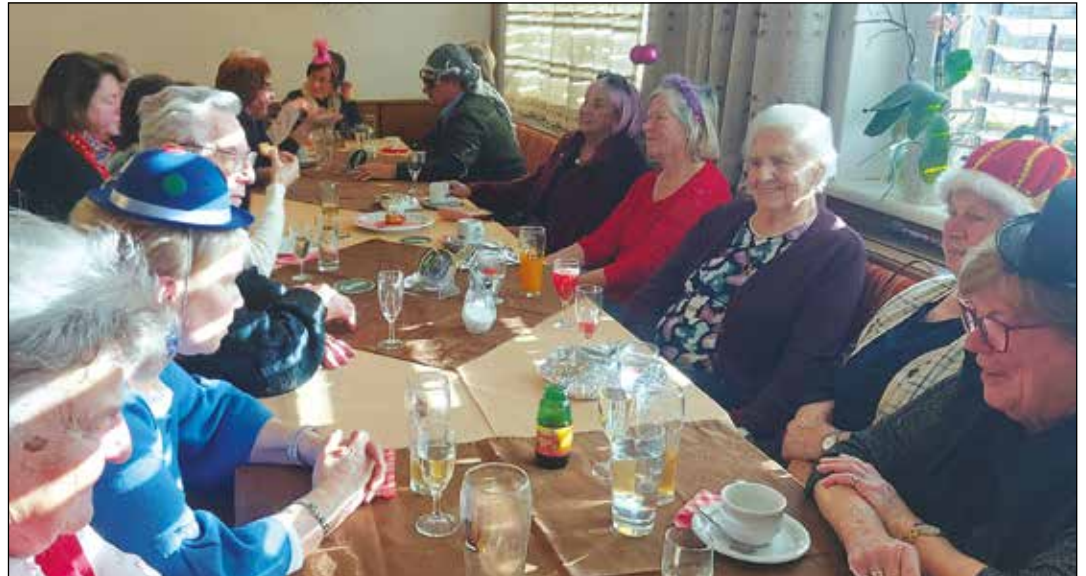
Beste Stimmung beim Faschingsnachmittag der Senioren im Gasthof Kaiser in Treffelsdorf.