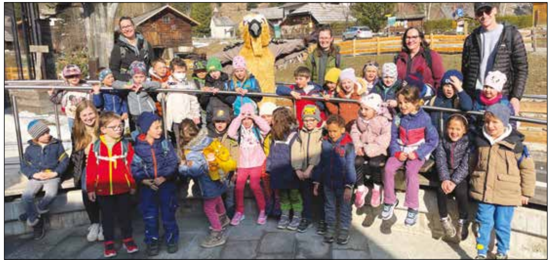
Die Kinder des letzten Kindergartenjahres besuchten das BIOS Nationalparkzentrum Mallnitz.

Am Mittwoch, dem 18. März durfte eine Gruppe unseres Kindergartens den Biohof Mayer in Tratschweg besuchen, der sich ganz der Schafzucht verschrieben hat.