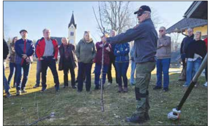
Der Obstbaumschnittkurs lockt seit Jahren zahlreiche Teilnehmerinnen und Teilnehmer zu der Veranstaltung.

Besonders geschätzt wurden seine Einblicke in aktuelle Studien und neue Erkenntnisse rund um Pflanzenschutz, nachhaltige Düngung, klimafitte Gartenpflege sowie die wichtige Rolle von Bäumen als natürliche Schadstoff- und Feinstaubfilter. Viele Besucherinnen und Besucher zeigten sich begeistert, wie praxisnah und verständ-