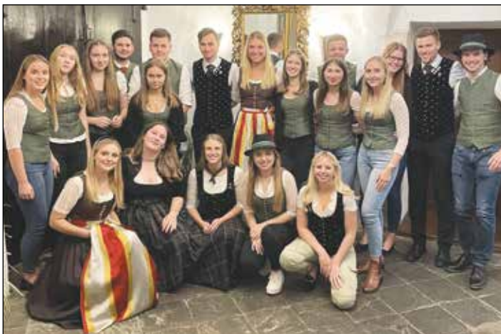
Auch bei der LJ-Bezirksjahreshauptversammlung waren wir mit vielen Mitgliedern vertreten.