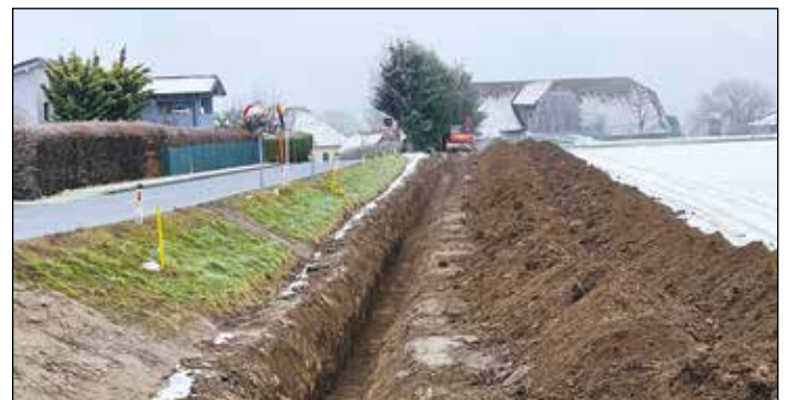
Ein Teil der alten Hauptwasserleitung im Bereich Überfeld (Hochbehälter bis ehem. GH Adl) wurde erneuert.

Die Wasserleitungen in Teilen der Gemeinde (Kraig, Überfeld, Hunnenbrunn, usw.) sind teilweise über 60 Jahre alt. In den kommenden Jahren kommen wir nicht umhin, diese auszutauschen. Die Planungen dafür beginnen 2024.