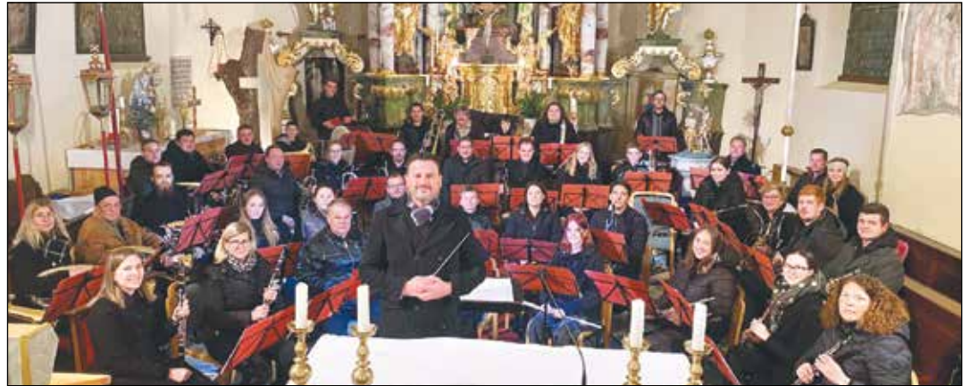
Benefizkonzert für den neuen Glockenstuhl in Obermühlbach.