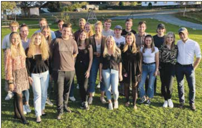
Bei der LJ-Fest-Nachfeier am Kraigerberg.