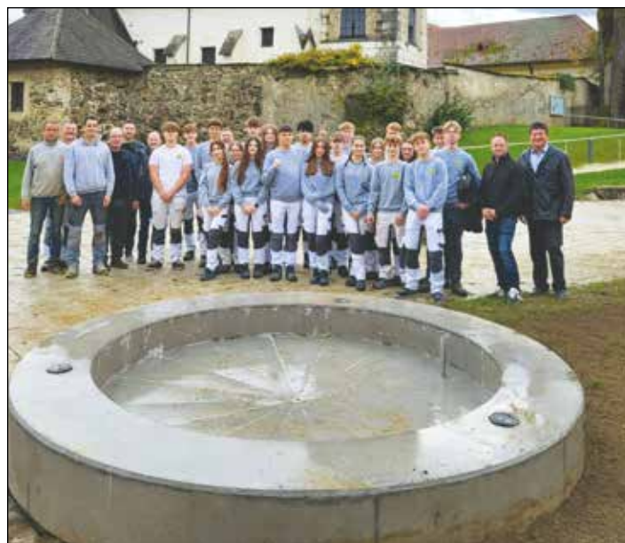
Am 20. Oktober wurde der neue Dorfbrunnen, den die Schülerinnen und Schüler und Lehrer der HTL Villach bauten, in Obermühlbach versetzt und angeschlossen.