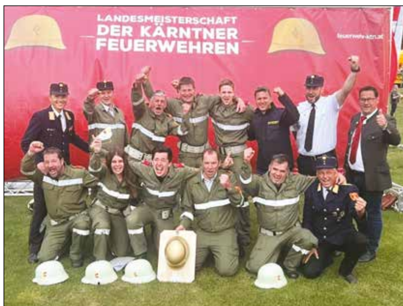
Die siegreiche Wettkampfgruppe der Freiwilligen Feuerwehr Treffelsdorf mit dem "Bronzenen Helm".

Facebook Feuerwehr Treffelsdorf Instagram: feuerwehr.treffelsdorf