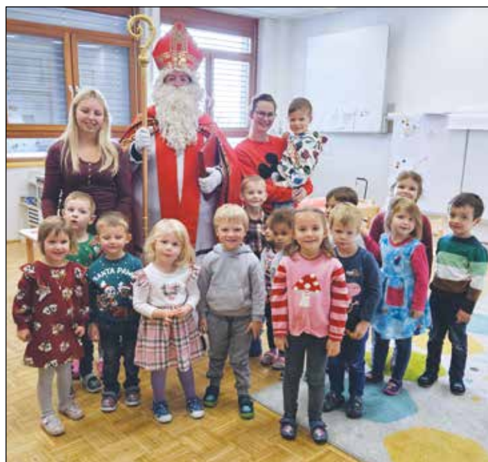
Der Nikolo besuchte auch unsere neu eröffnete 4. Gruppe unseres Kindergartens, die in der VS Kraig untergebracht ist.