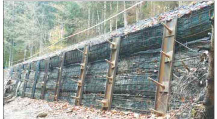
Die Mellacher Straße musste aufwendig saniert werden. Die Neuasphaltierung erfolgt im kommenden Jahr.