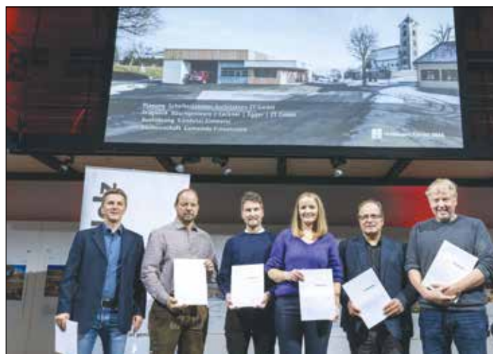
„Unser neues Rüsthaus mit Mehrzwecksaal wurde mit einem Anerkennungspreis bei der diesjährigen Verleihung des Holzbaupreises ausgezeichnet.“

Planung: Scheiberlammer Architekten ZT GmbH Tragwerksplanung: Bauingenieure Lackner Egger ZT GmbH Ausführung: Kandussi Zimmerei Bauherrschaft: Gemeinde Frauenstein