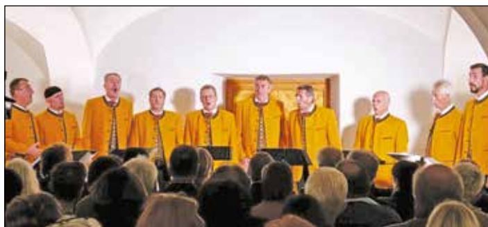
Die Vokalsolisten begeisterten das Publikum beim Herbstkonzert im Kulturstadl in Hintnausdorf.

Aufgrund des großartigen Erfolges und der vielen Nachfragen ist bereits ein Herbstkonzert für 2024 geplant.