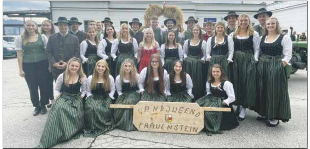
Alljährlich vertritt auch die Landjugend Frauenstein unsere Gemeinde beim traditionellen Wiesenmarktumzug in St. Veit an der Glan.

Nun steht Weihnachten vor der Türe und unser Programm geht gleich weiter. Wie jedes Jahr führen wir auch heuer wieder unser Hirtenspiel auf. Wir würden uns freuen, euch am 24.12. um 15:00 Uhr in Obermühlbach, um 23:00 Uhr in Dreifaltigkeit und am 25.12. um 10:15 Uhr in Kraig von der Weihnachtsstimmung verzaubern zu lassen. Außerdem brachten auch