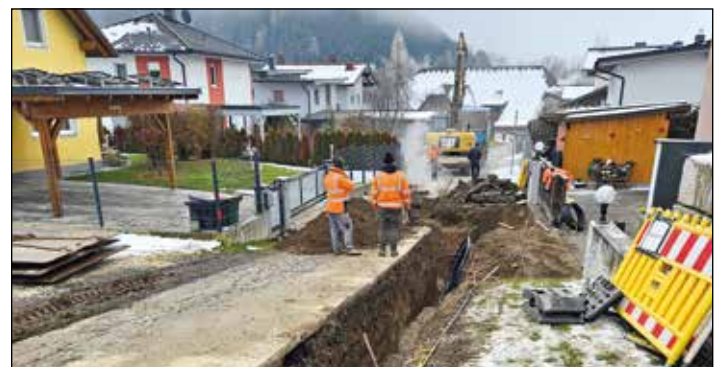
Eine Verbindungsleitung im Feldweg in Kraig soll die Versorgung im Bereich Müllersiedlung und Feldweg absichern.