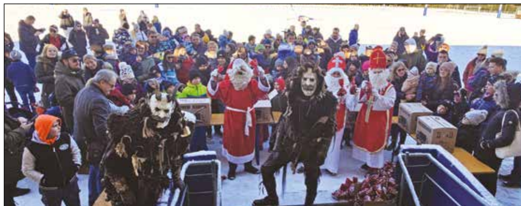
Viele Kinder freuten sich über den Nikolobesuch am Sportplatz in Kraig.

Leider musste das für 2. Dezember gemeinsam mit der Gemeinde Frauenstein geplante Nikolospringen wetterbedingt um einen Tag verschoben werden. Bei strahlendem Wetter flogen am Sonntag aber dann doch die Nikolos in das Kraiger Stadion und brachten jedem Kind und