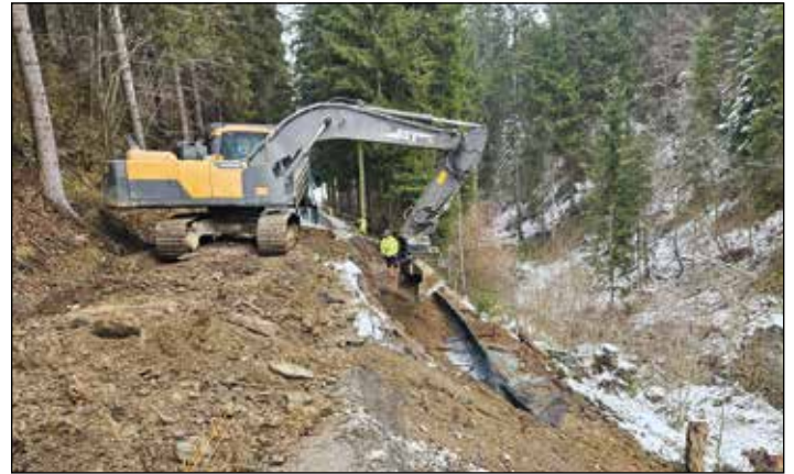
Die Sanierung der Verbindung von Kraig nach Meiselding wurde vor kurzem begonnen.

Wir bedanken uns bei der Bevölkerung für das aufgebrachte Verständnis.