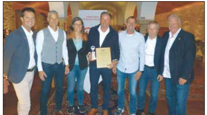
Ehrung unserer Meistermannschaft Herren 50+ im schönen Ambiente auf der Burg Taggenbrunn.

Wir wünschen Ihnen und Ihrer Familie eine ruhige Weihnachtszeit, gesegnete Feiertage und ein gesundes Jahr 2024. Turnverein Kraig