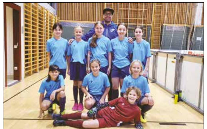
Das Mädchenteam aus Spielerinnen von Kraig, Guttaring und Kappel begeisterte beim Fundermax Rookies Cup.