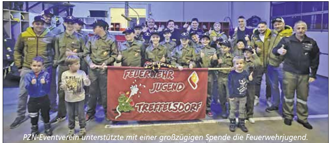
PZN-Eventverein unterstützte mit einer großzügigen Spende die Feuerwehrojugend.

Wir wünschen euch allen ein Gesegnetes Weihnachtsfest und ein gutes neues Jahr 2024.