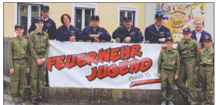
Fünf Mitglieder unserer Jungfeuerwehr aus Kraig nahmen erfolgreich beim Wissensspiel und Wissenstest der Feuerwehrjugend in Grades teil.