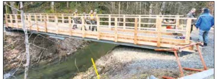
Mit Hilfe des Baupionierzugs des Militärkommandos Kärnten wurde die Brücke Mellach - Wimitz neu errichtet.

Wir wünschen allen künftigen Benützerinnen und Benützern alles Gute.