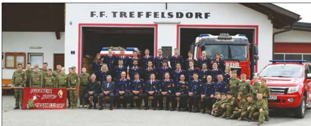
Die Kameradinnen und Kameraden der Freiwilligen Feuerwehr blicken auf ein erfolgreiches (Wettkampf-)Jahr 2023 zurück.

"Unglaublich, dass es uns gelungen ist! Vielen Dank an euch alle. Ohne das jahrelange Training von allen Kamerad:innen und das Verständnis unserer Familien wäre dies nicht möglich gewesen. Ich bin stolz auf unsere Freiwillige Feuerwehr Treffelsdorf", so Ortsfeuer-