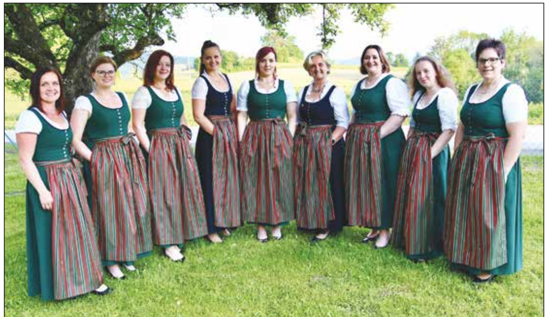
Die Sängerinnen der Singgemeinschaft Wimitzerberge wünschen allen ein besinnliches Weihnachtsfest und viel Gesundheit und Kraft für das Jahr 2024.