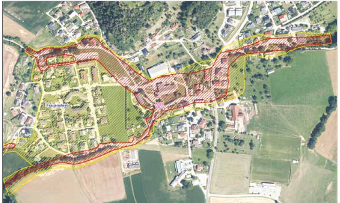
Große Bereiche von Kraig sind durch Überschwemmungen gefährdet. In der "roten Zone" herrscht sehr große und in der "gelben Zone" noch immer große Überflutungsgefahr bei Hochwasser.

Für das Projekt Hochwasserschutz für die Ortschaft Kraig wurde in Zusammenarbeit mit der BH-St. Veit/Glan im heurigen Jahr auf Hochtouren gearbeitet. Die notwendige Wasserrechtsverhandlung mit den betroffenen Grundstücksbesitzern fand am 24. 4. 2023 statt. Damals wurde festgelegt, mit den Grundstücksbesitzern, die noch keine Zustimmungserklärung zum Hochwasserschutzprojekt abgegeben haben, weitere Gespräche zu führen. Viele der Grundstücksbesitzer haben eine Zustimmungserklärung für den Wasserrechtsbescheid zu dem vorgestellten Hochwasserschutzprojekt abgegeben. In den letzten Monaten und Wochen